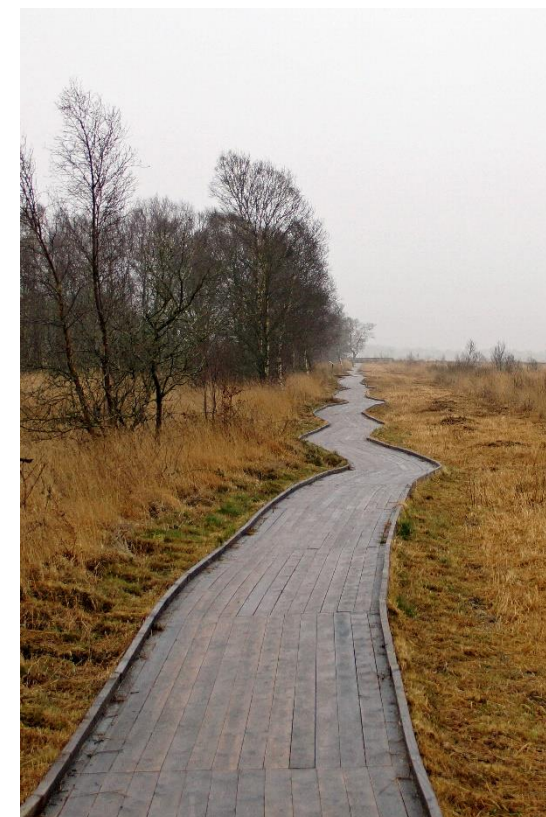
„Weg zum Ewigen Meer“ von Ralf Flinspach