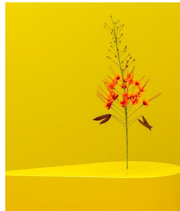
„yellow art“ von Waltraud Wiget