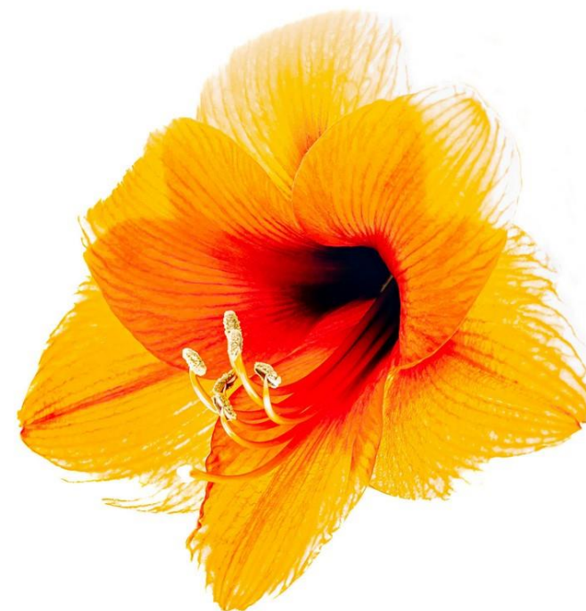
„Amaryllis“ von Nikolaus Fuchs